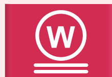
Zeer milde natte reiniging