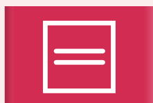
Kletsnat en liggend drogen