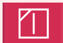
Aan de waslijn in de schaduw drogen