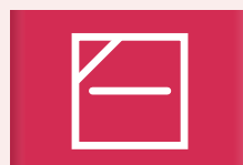
Liggend drogen in de schaduw