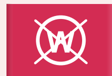
Niet nat reinigen