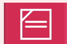
Kletsnat en liggend drogen in de schaduw