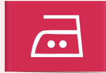
Bij matige hitte strijken