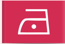
Niet heet strijken