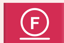
Voorzichtige behandeling met koolwaterstof