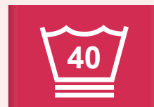
40 °C speciaal wasprogramma