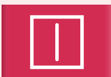
Drogen aan de waslijn