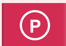
Behandeling met perchloorethyleen