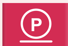
Voorzichtige behandeling met perchloorethyleen