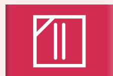
Kletsnat op een droogrek in de schaduw drogen