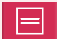
Kletsnat en liggend drogen