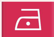
Niet heet strijken