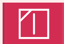
Op een droogrek in de schaduw drogen