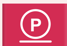
Voorzichtige behandeling met perchloorethyleen