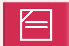
Kletsnat en liggend drogen in de schaduw