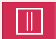
Kletsnat drogen op een droogrek