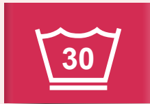
30 °C antikreukprogramma of fijne was