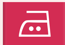
Bij matige hitte strijken