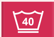
40 °C antikreukprogramma of fijne was