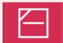
Liggend drogen in de schaduw