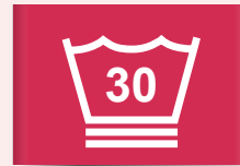
30 °C speciaal wasprogramma