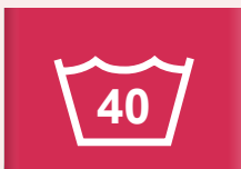
40 °C normale was